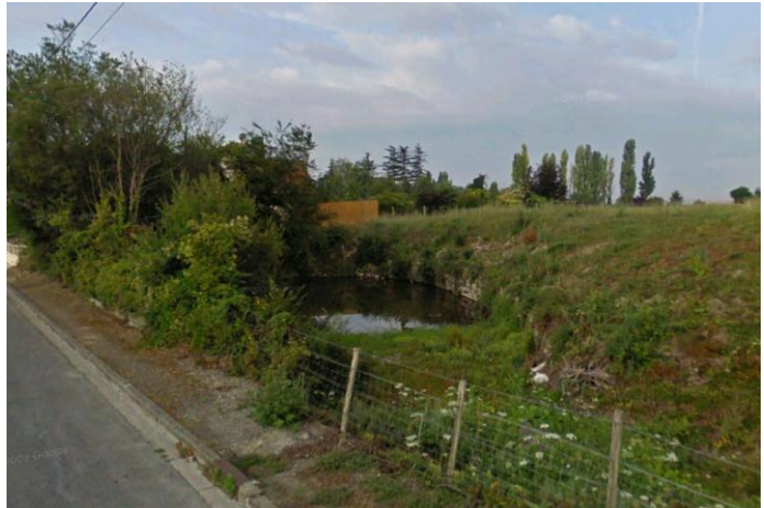
Vue de la Mare des Tuileries depuis la rue de la Tuilerie

C'est pourquoi la Municipalité de Saulx-Marchais souhaite préserver les éléments d'eau présents sur son territoire. La Mare de la Tuilerie a ainsi été protégé au titre de l'article L123-1-5 7° du Code de l'Urbanisme.